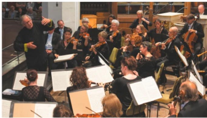
PROTAGONISTI Sir John Eliot Gardiner, direttore pioniere: ha fondato anche il Monteverdi Choir