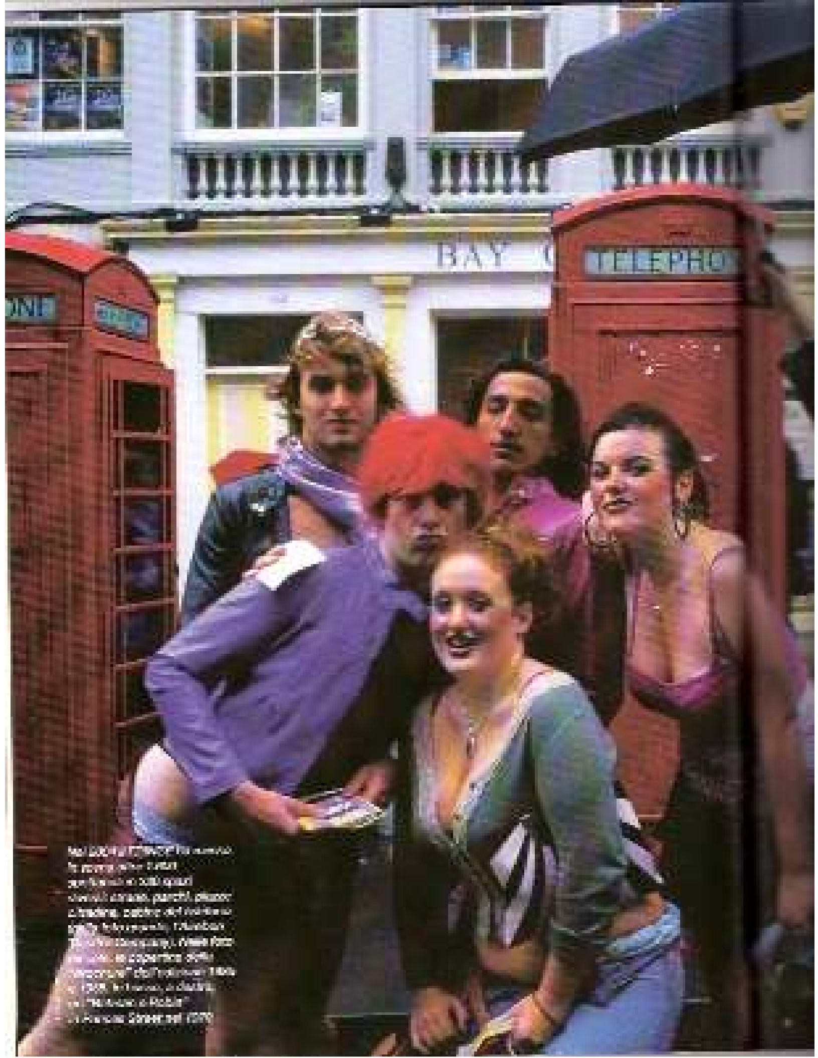
Nel 2004 il FTSE100 ha cominciato a tornare nelle tinte verdi e molti si sono spinti a dire: siamo parchi, siamo trading, siamo del tutto in grado di farcela. I bambini di strada tornano, come foto di una ragazza della "London Underground" del febbraio 1980 e 1981. In basso, a destra, la "London Underground" nel 1970.