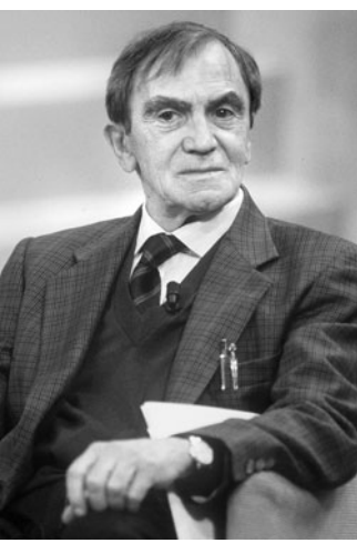
IL DETECTIVE E I ROBOT Qui a sinistra una scena di «Io, robot» con Will Smith. Sopra, Carlo Rambaldi, il padre di E.T. : «Perché immaginiamo i robot con sembianze umane?»