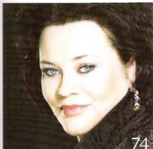
Illustrasjon: Nils Erik B. 2012