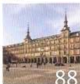
Illustrasjon: Nils Erik B. 2012