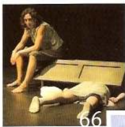
Illustrasjon: Nils Erik B. 2012