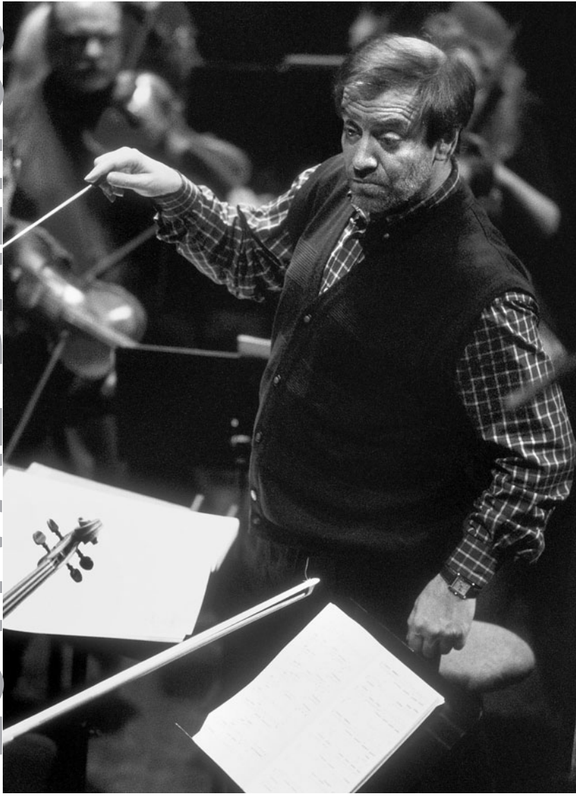
INNOVATORE Valery Gergiev in pochi anni ha trasformato l'ambiente musicale russo