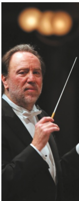
SUL PODIO il direttore Riccardo Chailly