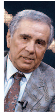
SIMBOLO Enzo Tortora

dal canto suo sottolinea: «Qualora il documentario venisse offerto alla Rai, l'azienda sarebbe lieta, dopo un'attenta valutazione della qualità del prodotto, di acquisirne i diritti televisivi». Tanto è bastato per rafforzare le speranze di Crespi che ha subito dichiarato: «Apprendo con grande soddisfazione e interesse la disponibilità della Rai di considerare l'eventualità della messa in onda del mio documentario». Francesca Scopelliti invece, ex compagna di Tortora, ha lamentato l'indifferenza della Rai verso la vicenda del conduttore.