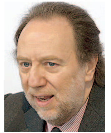
MAESTRO Riccardo Chailly

Pereira, orchestra e cda: tutta la Scala (non la burocrazia) vuole Chailly