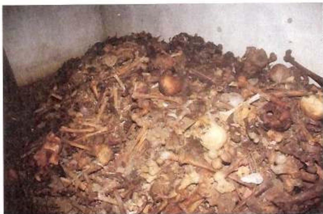
MANGE HEMMELIGHETER: På kirkegården i Porto Ercole er del gravd opp skjelettresten etter mange mennesker.