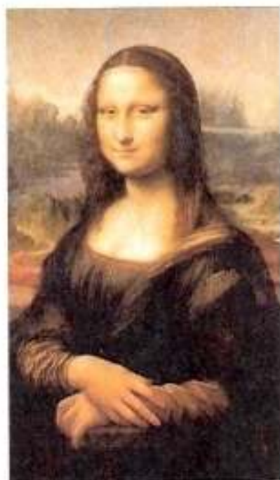
MONA LISA: Kanskje bærer hun Leonardo da Vincis ansikt.