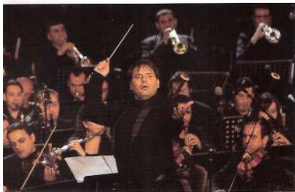
Ungg Minak Baghboudarian er sjefdirigent for Syrias nasjonale symfoniorkester