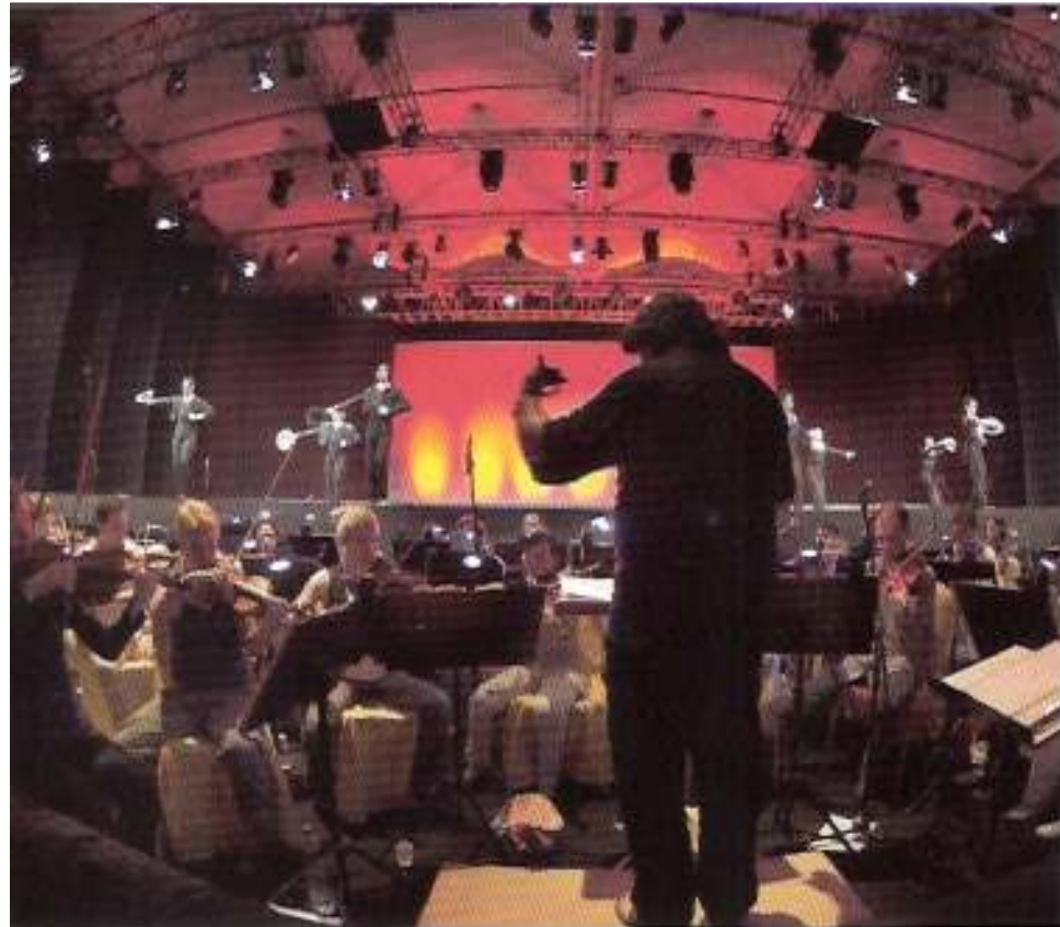
Plácido Domingo dirigerer en zarzuela-konsert i konsertarenaen The Pearl, Qatar