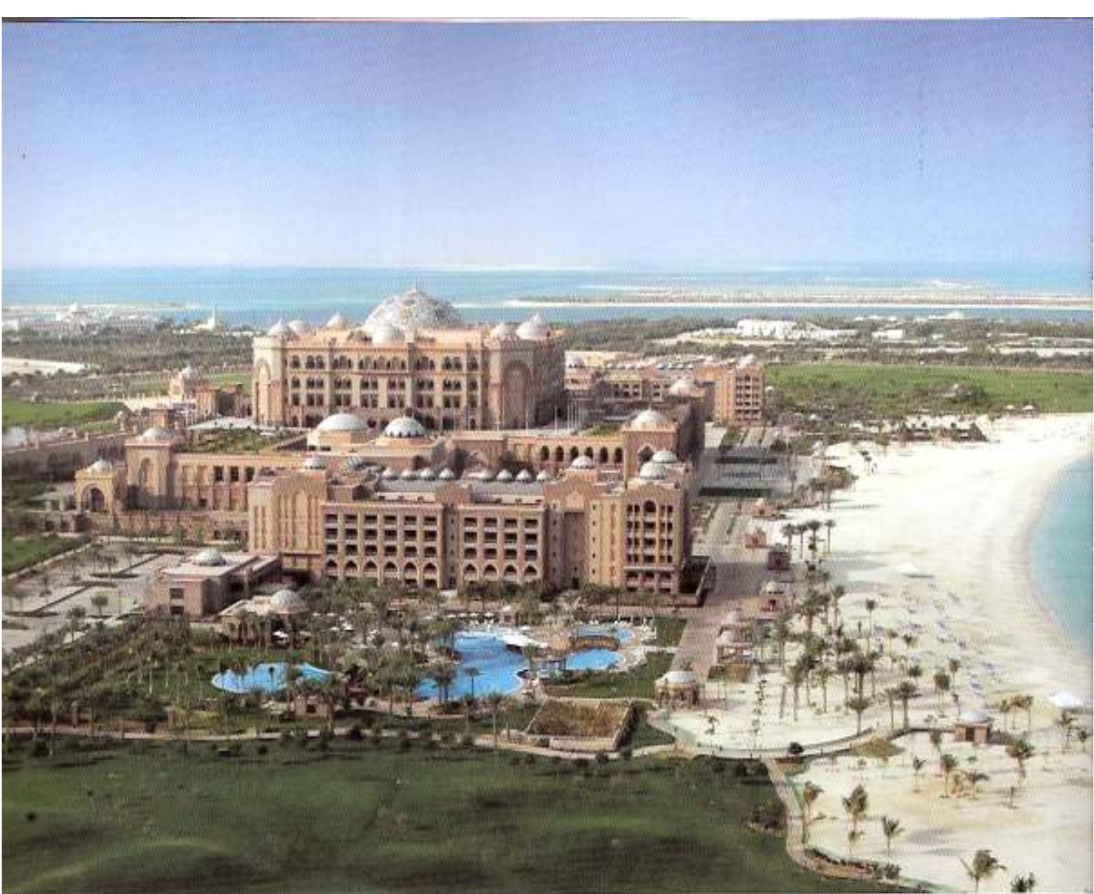
Emirates Palace i Abu Dhabi har hvit strand og svømmebasseng på alle kanter på utsiden og opera- og konsertsal på innsiden