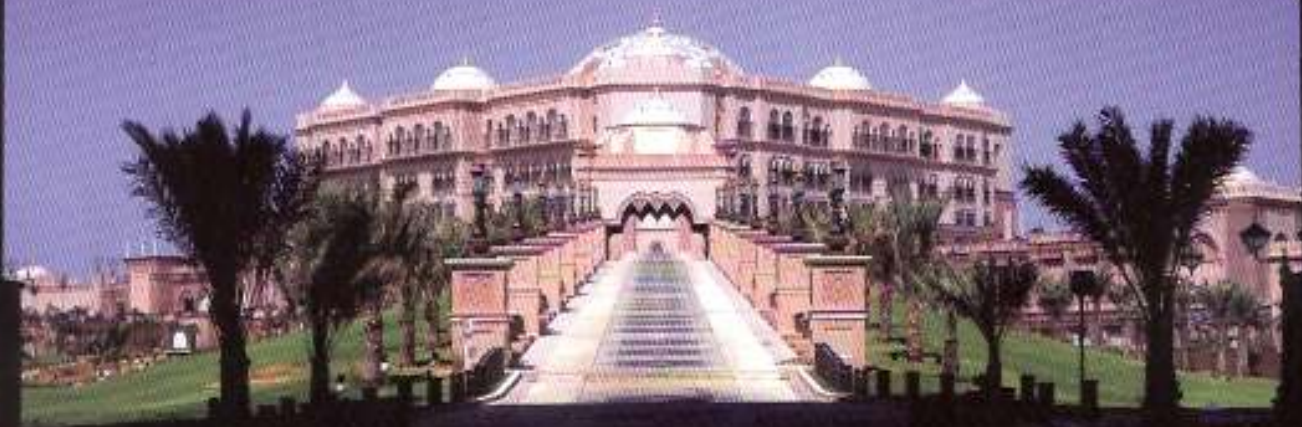
Det storslagne Emirates Palace i Abu Dhabi.