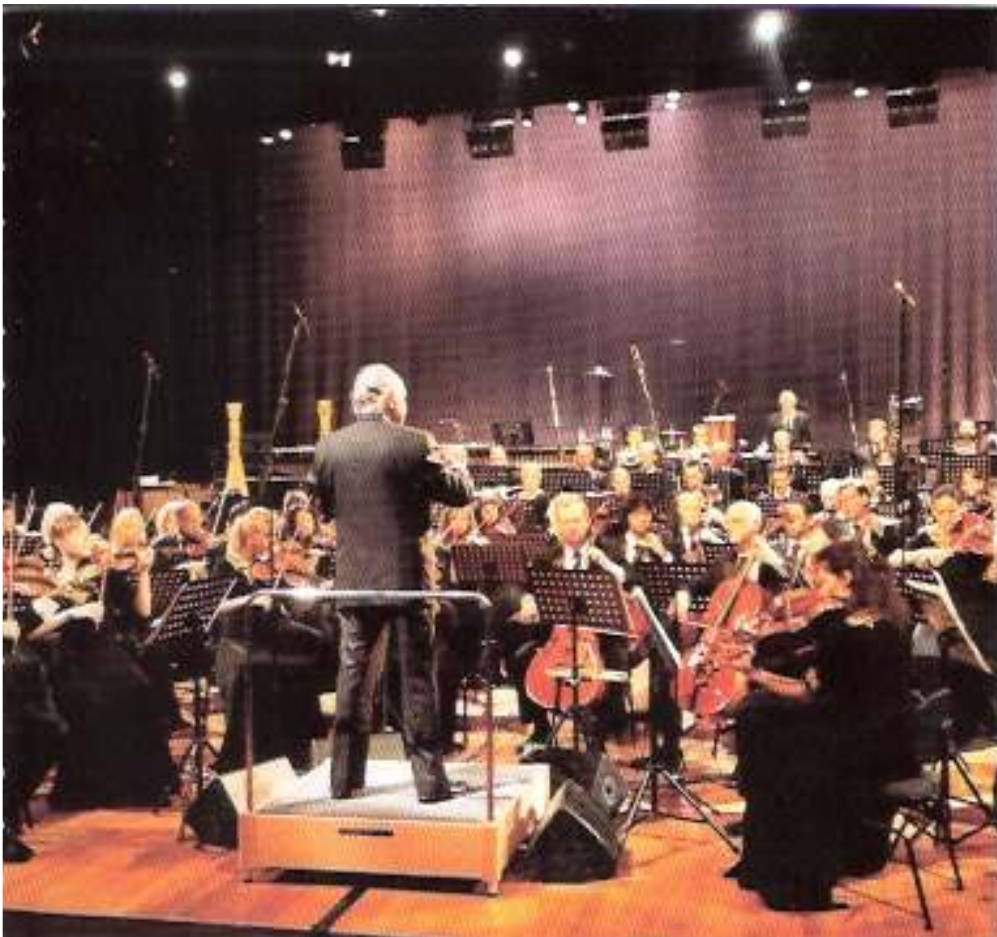
Dirigenten Lorin Maazel med Qatar Filharmoniske Orkester ved deres festivalopning i Doha