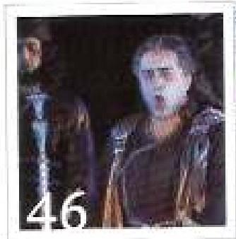
Die Kunst der Kunst