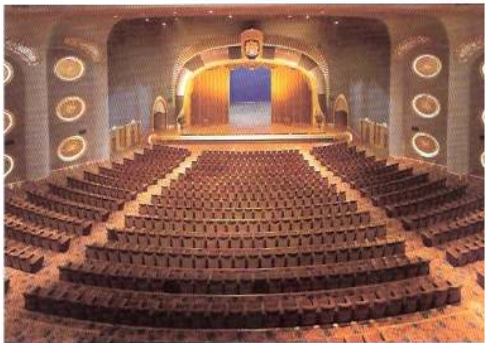
Den store salen i Emiratets Palace

- Så utvidet hun med en klasse for blåsere og slagverksinstrumenter, og opprettet senere et kurs i arabisk musikk, samt i sang og klaver. Etter ti år var den første generasjonen musikere klare, og slik lærte vi at Konservatoriet kunne strekke seg mot høyere utdannelsesnivåer. Da tok vi skrittet til neste fase. Jordan bestemte seg for å opptre som et moderne og kosmopolittisk arabisk land, og til å investere i kulturturnisme. Musikk ble en meget viktig del av kultur industrien, og virkningen på den økonomiske veksten, direkte og indirekte, kan ikke overses, sier rektor Fakhouri.