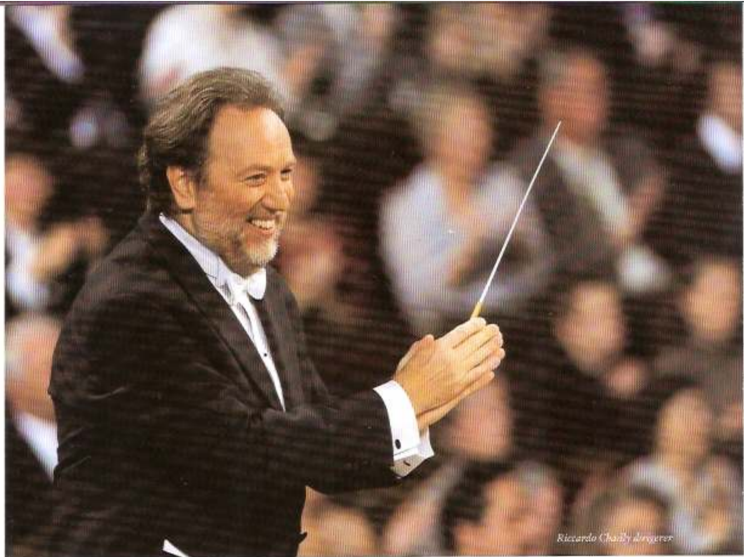
Riccardo Chailly dirigerer