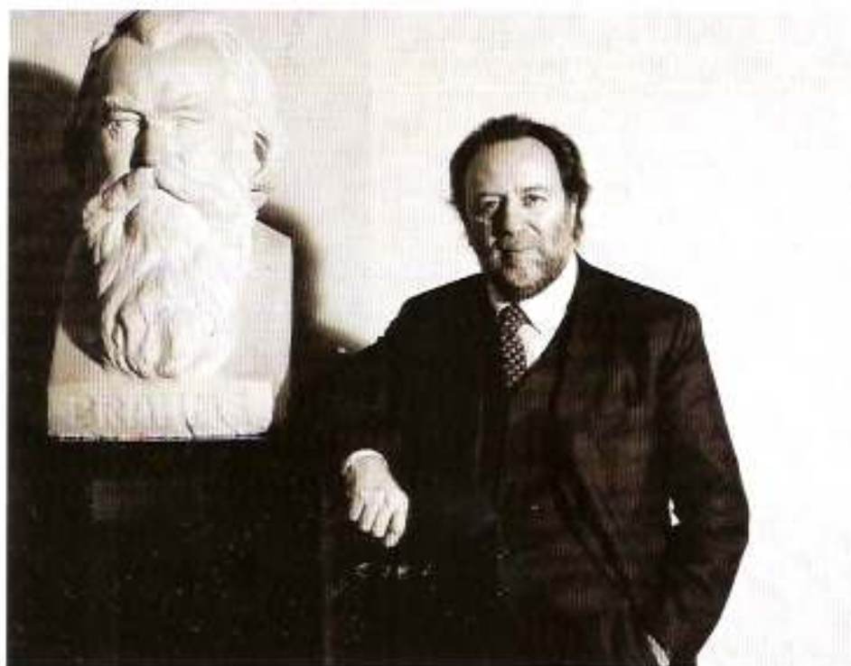
Riccardo Chailly ved en byste av Bruckner

Jeg liker å hoppe fordi det gir meg følelsen av å fly. Jeg gjør det ikke så ofte lenger, men kjører fortsatt motorsykel – riktignok ikke med samme grad av begeistring som da jeg var barn, sier han – kanskje med tanke på ulykken som holdt på å ta livet av ham for rundt tyve år siden. Ønsker han noen gang å slippe ut fra anstrengelsene på podiet?